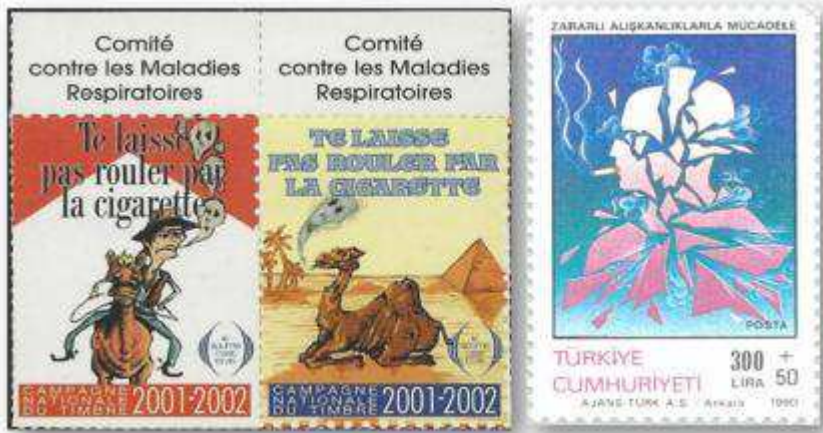
Erst spät wurde Werbung gegen das Rauchen gemacht. In der Philatelie findet man jedoch viele Beispiele von Anti-RaucherKampagnen (Franz. Reklamemarken, Türkei 1990)