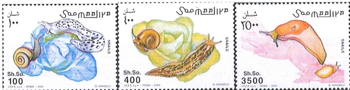
Abb. 1: Limax monregalensis

Wer in der Philatelie nach Limax sucht, tut sich besonders schwer. Einen Arion kann man da und dort auf einer Marke oder einem Stempel finden, aber die Limacidae sind so selten wie hin und wieder in der Natur selbst. Umso mehr erstaunt war ich, als ich drei Briefmarken der afrikanischen Bundesrepublik Somalia aus dem Jahr 2003 entdeckte, die drei italienische Limaces zeigen. Auffällig an den Marken ist, dass die Arten leicht determinierbar sind, weil typische Merkmale sehr gut herausgearbeitet sind. Gestochen sind die Marken von G. VANGELLI und gedruckt in der italienischen Staatsdruckerei (Istituto Poligrafico e Zecca dello Stato), Rom. Italien verbindet mit dem ehemaligen italienischen Protektorat Italienisch-Somaliland, das 1960 mit Britisch-Somaliland vereinigt und als neuer afrikanischer Staat in die Selbständigkeit entlassen wurde, wohl noch Einiges. Leider versinkt Somalia, wie viele andere ehemalige Kolonialstaaten (heute meist Entwicklungsländer genannt), im Sumpf von Krieg und Korruption.